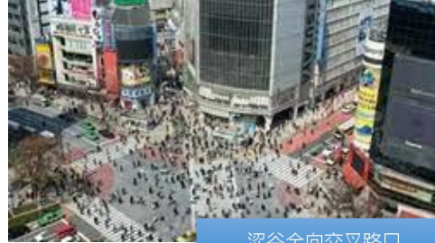
涩谷全向交叉路口